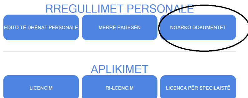
Foto 1. Ngarko Dokumentin

Sigurohu se ne kuadër të dosjes të juaj keni ngarkuar dokumentet e nevojshme për licencim si leternjoftimin, certifikaten e provimit te licences dhe taksen administrative