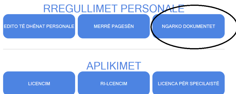
Foto 1. Ngarko Dokumentin

Sigurohu se ne kuadër të dosjes të juaj keni ngarkuar dokumentet e nevojshme për ri-licencim duke përfshirë edhe certifikatat e EVP-së për aktivitetet e ndjekura.